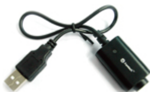
Зарядное устройство от USB-порта

Зарядное устройство совместимо с предыдущими моделями eGo и eGo-T.