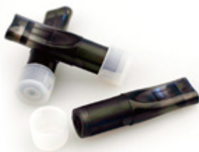
Картридж eGo-C («танкового» типа)

Основной элемент атомайзера – испаритель . Он легко заменяется и устанавливается внутрь корпуса атомайзера.