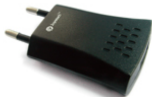
Сетевой адаптер питания USB – 220 В

Для электронной сигареты eGo-C используется тот же тип картриджей, что и для eGo-T (Тип А), вмещающий 1.0 мл жидкости.