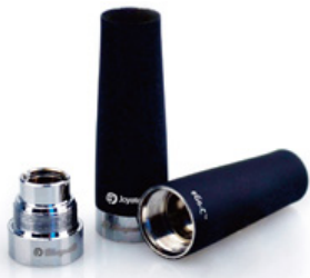
Атомайзер Joye eGo-C

Атомайзер состоит из основания, корпуса и нагревательного элемента (испарителя) — сменной части атомайзера.