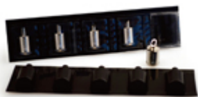
Сменный испаритель (нагревательный элемент)

Атомайзер состоит из основания, корпуса и нагревательного элемента (испарителя) — сменной части атомайзера.